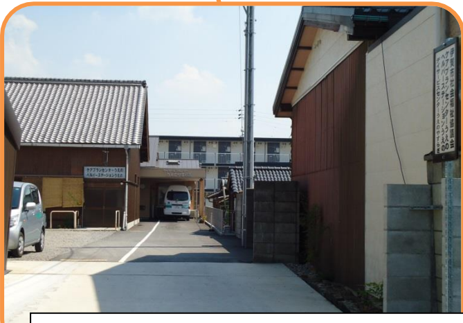
☆デイサービスセンターうえのやすらぎ 外観