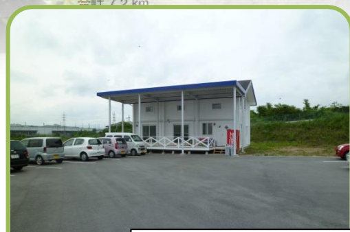
☆休憩所外観+駐車場