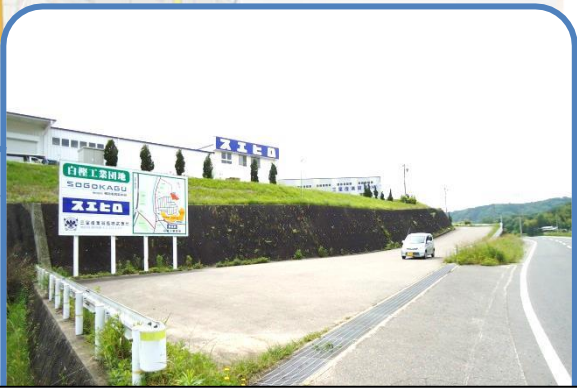
☆工業団地の看板が見えたら、坂を上がる。