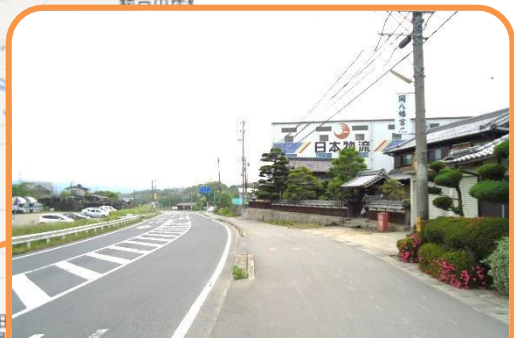
☆日本物流の建物が見えたら右折。 (国道 82 号線)