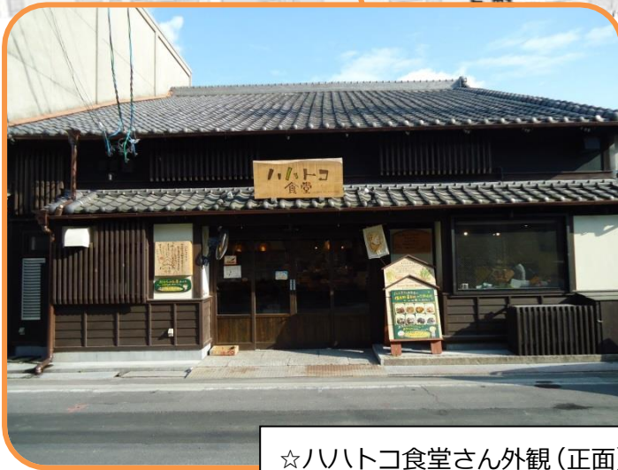
☆ハハトコ食堂さん外観(正面)